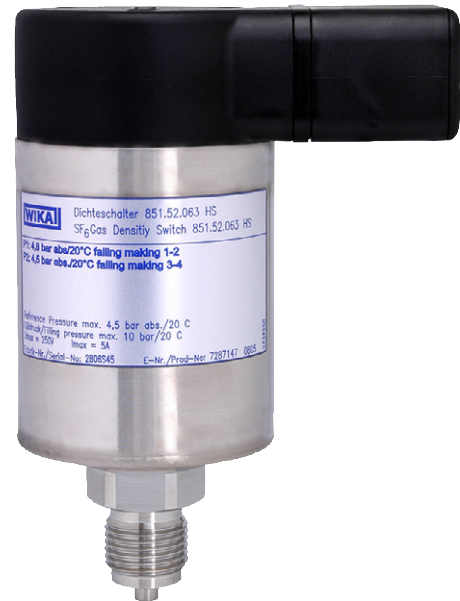
Gasdichteschalter, Typ 851.52.063 HS