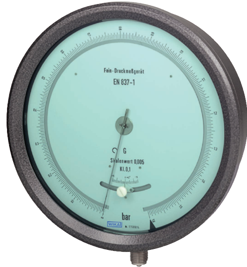
Série de précision type 342.11