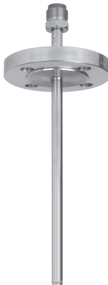
Poço de proteção com flange modelo SD200F

1) Valores dependentes dos seguintes parâmetros: